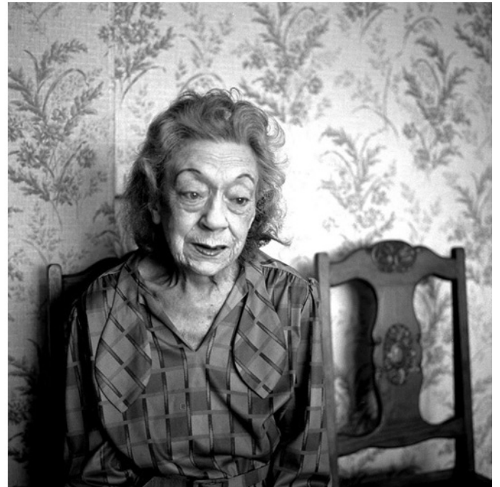
Les oubliés , 1990-1997

Extrait d'un ensemble photographique Argentique, N&B, dimensions variables