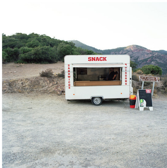
Lumière d'août : récits de Corse , 1998-2006