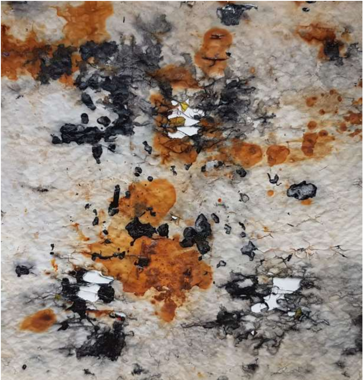
à travers 111 (verso) cible de tir à l'arc, rouille, encre de Chine 36x36 cm