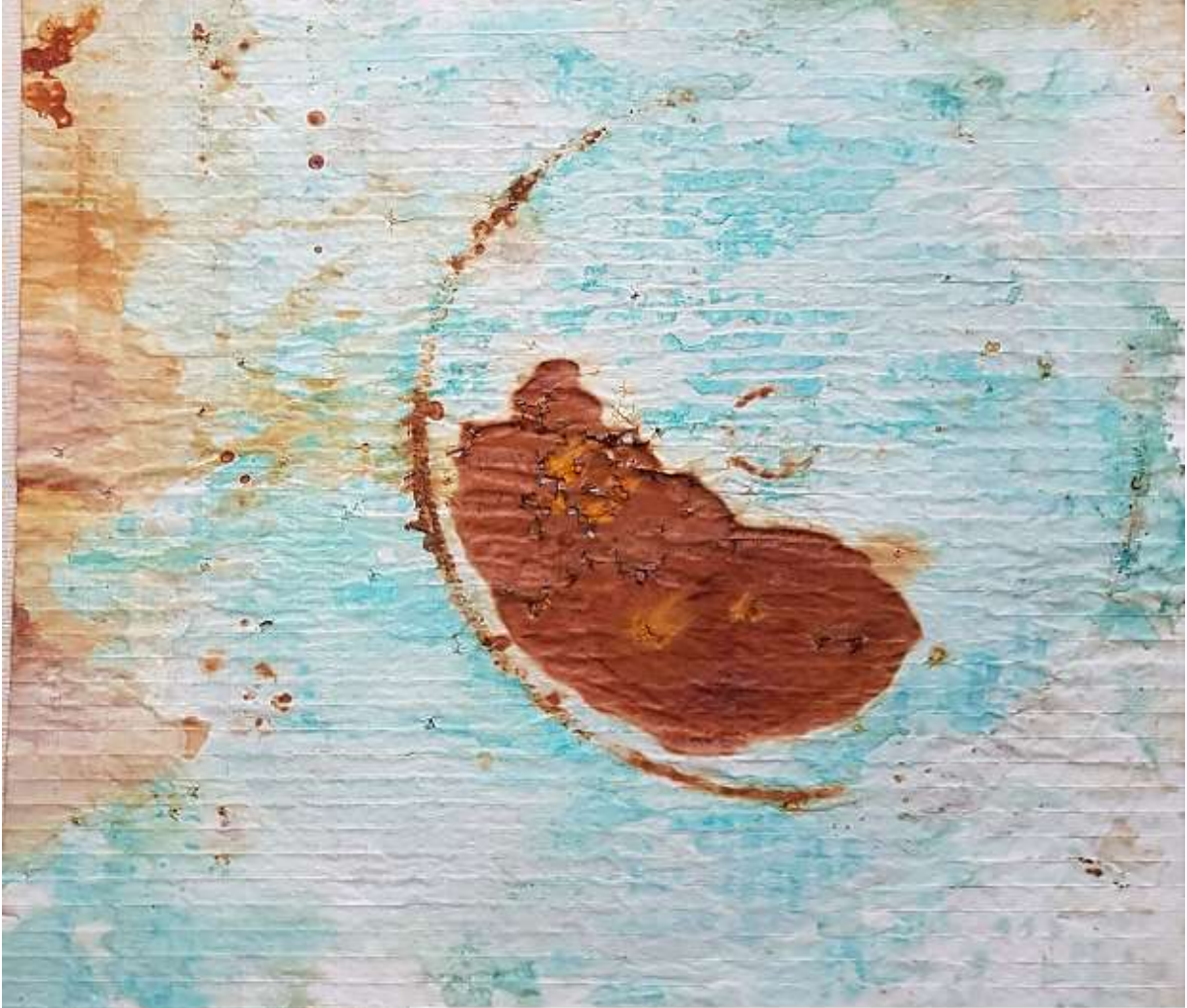
à travers 303 (verso) cible de tir à l'arc, rouille, encre de Chine 61,5x62,5 cm