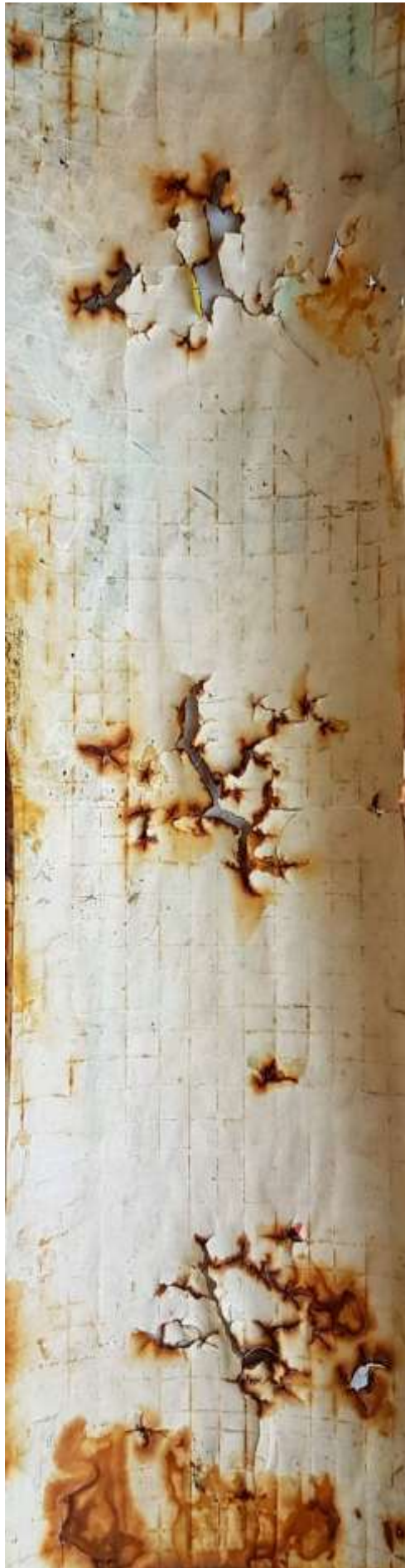
à travers 209 (verso - détail) cible de tir à l'arc, rouille, encre de Chine, 23x65,5 cm