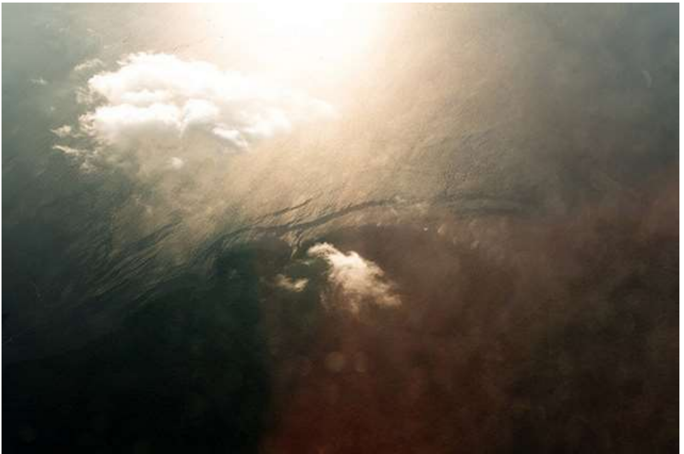
Thaïva Ouaki, Sans titre, tirage sur papier baryté, formats divers