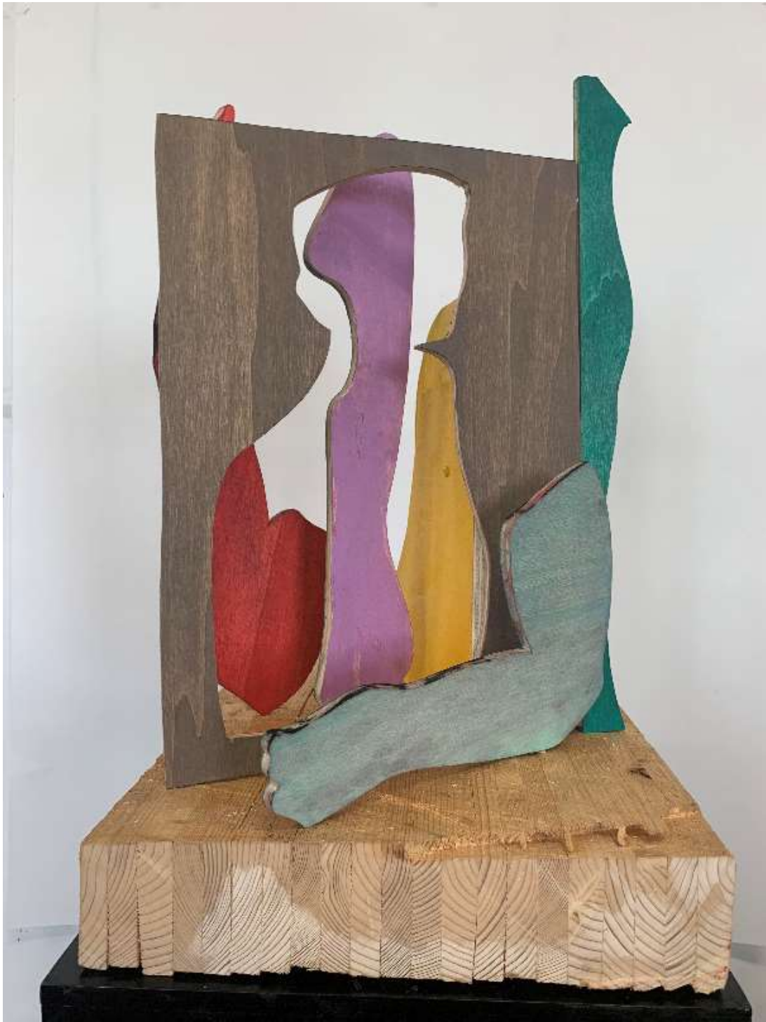
Daniel Clarke, Composition n°2, 2019, bois polychrome, 60 x 38 x 50 cm