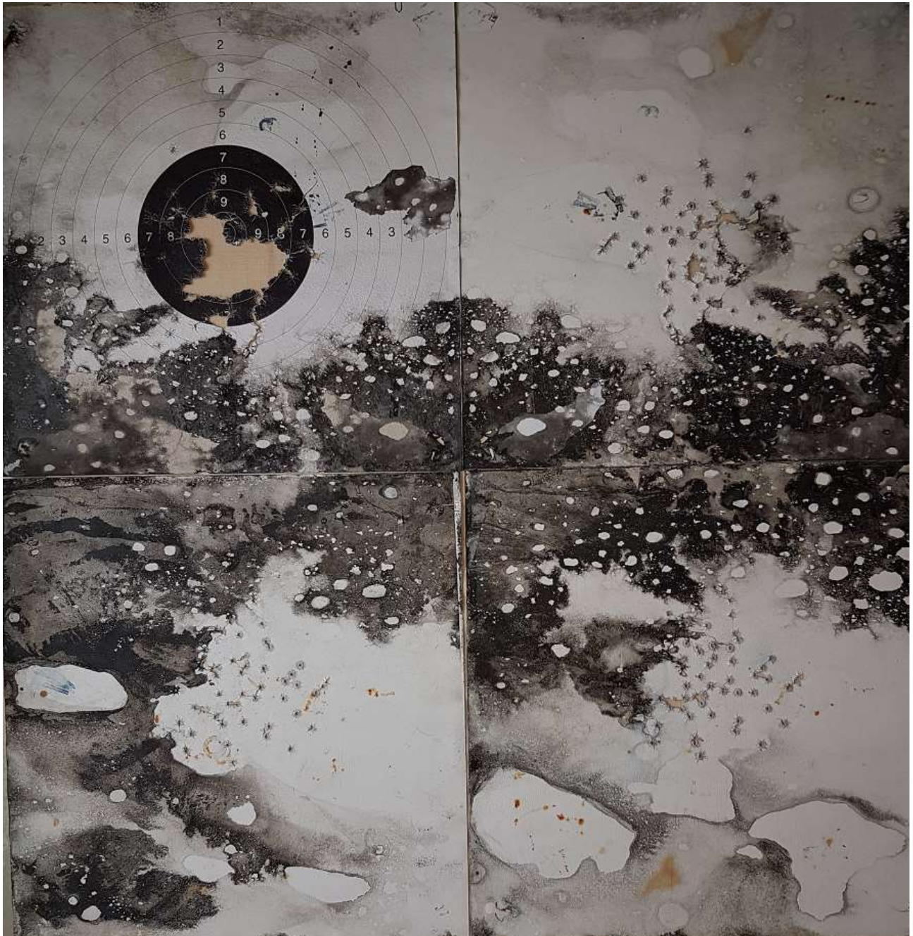
Chantal Fontvieille Souffle d'hiver sur Cibles, 2019, techniques mixtes sur cibles 50 x 50 cm