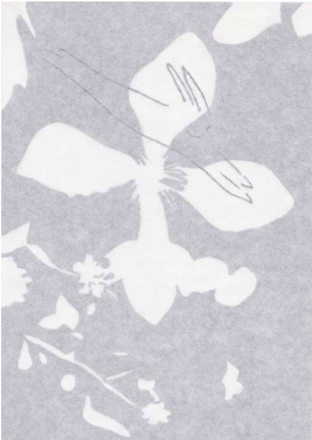
Christine Crozat Première rencontre avec le Lièvre 2012, dessin 24 x 12 cm