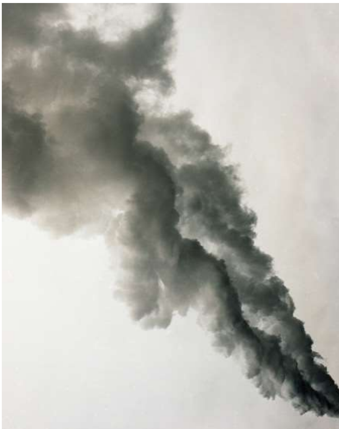
Julien Guinand Coal creek station Dakota du nord, Usa, 2016, Photographie, 80 x 100 cm