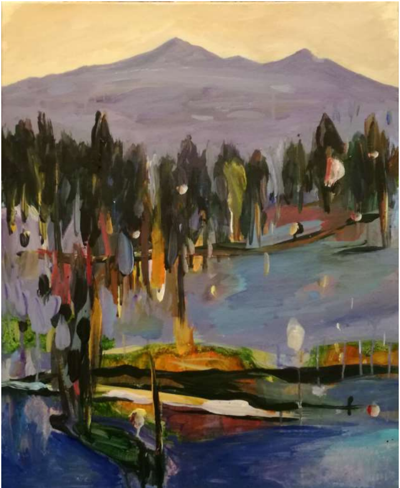
Clément Montolio Sans titre, 2019, acrylique sur toile, 61 x 50 cm