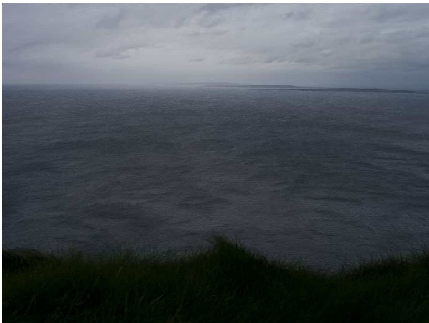
Gilles Verneret Eole souffle sur l'Océan, photographie, formats variables