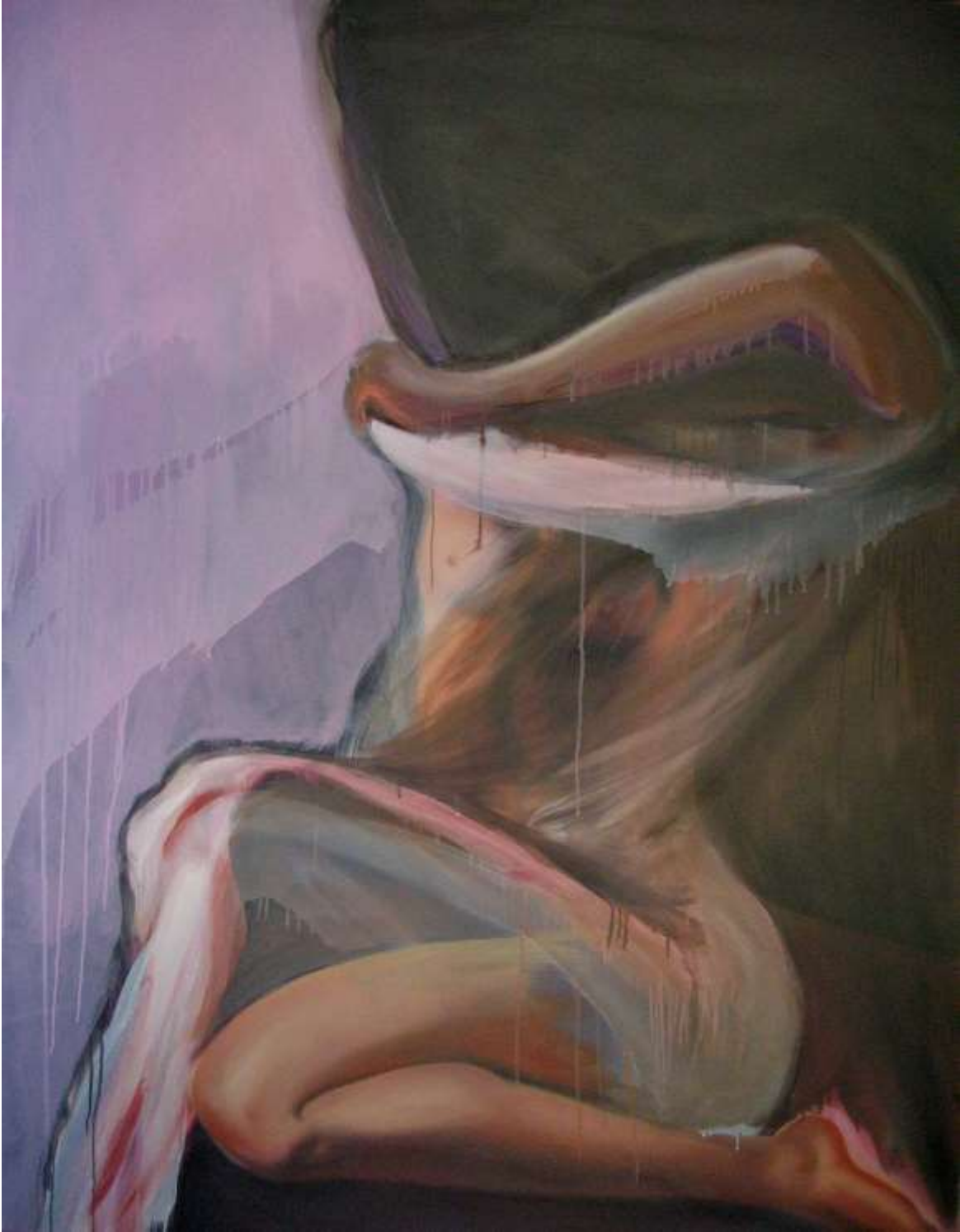
Jacques Migayrou, Sans titre, huile sur toile, 146 x 114 cm