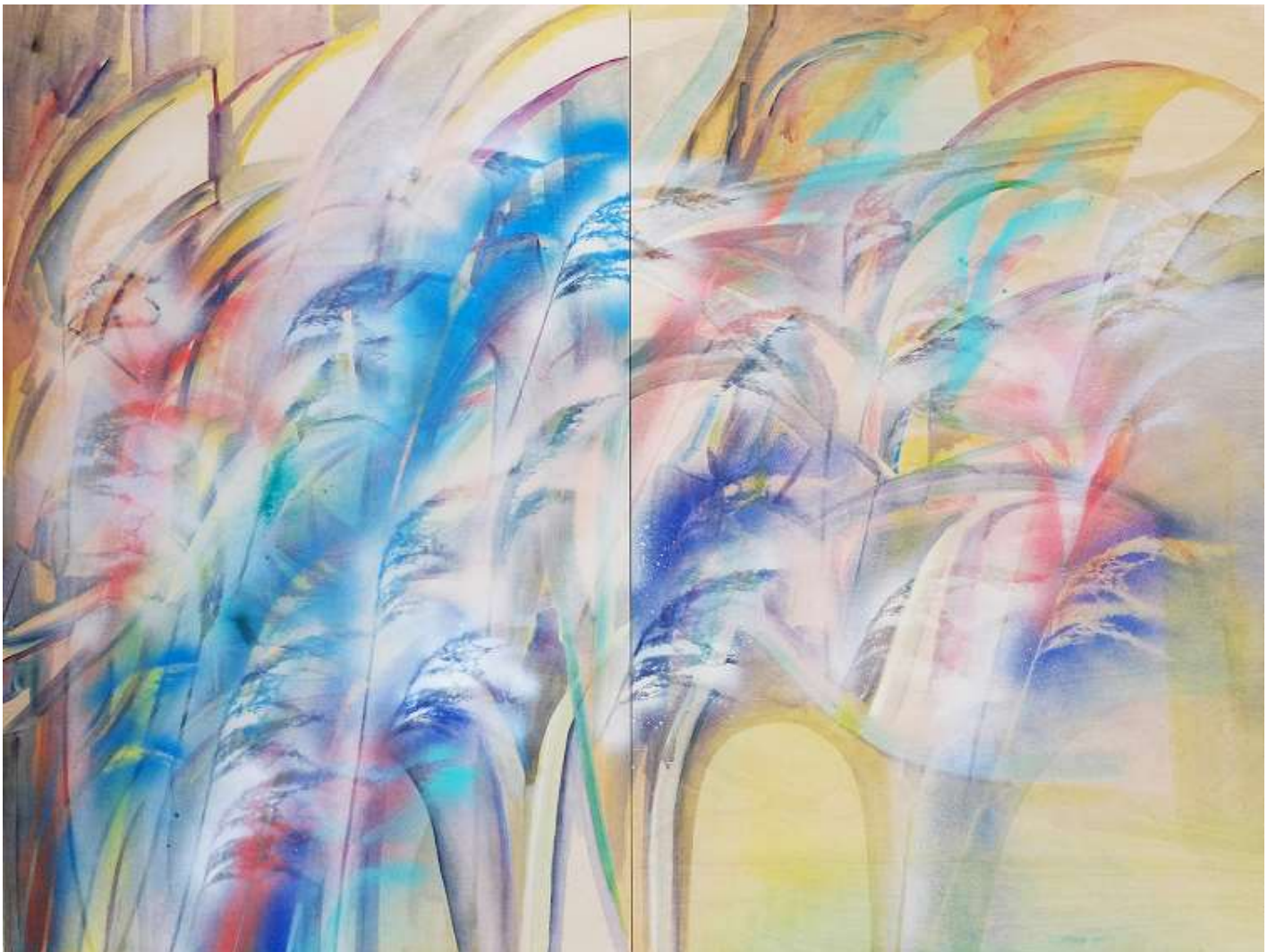
Lise Roussel Les roseaux, 2019, acrylique sur bois (diptyque) 120 x 160 cm