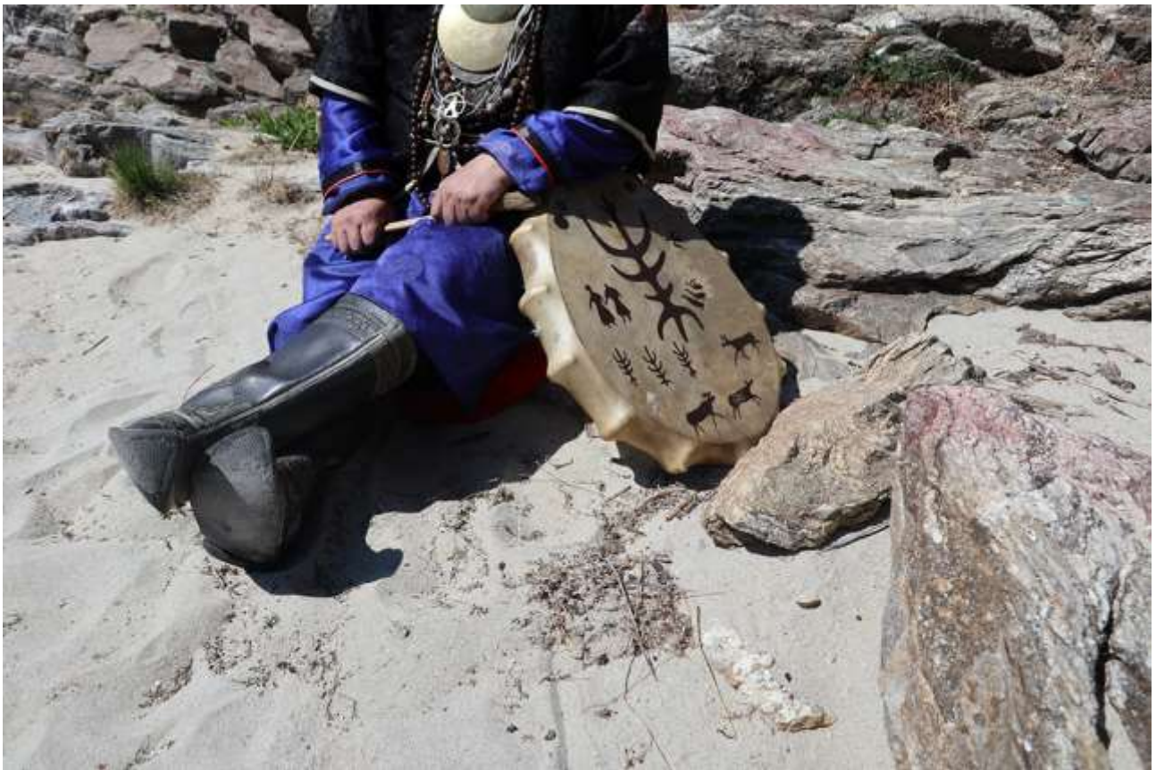
Laurent Mulot, Sitting Valentin, 2018, tirage de lecture, 41 x 61 cm