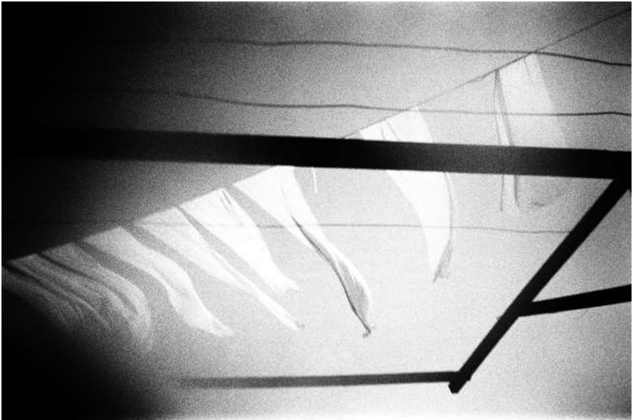
Stéphane Charpentier, C1024-14a, les voiles, 2019/2020, tirage sur papier Museo Silver, édition 1/8, 60 x 80 cm