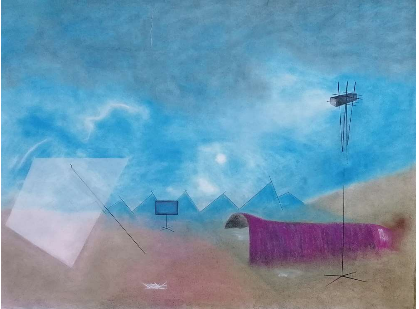
Frédéric Khodja, Le tournage abandonné, 2019, pigments, pastels secs et crayons sur papier 110 x 150 cm