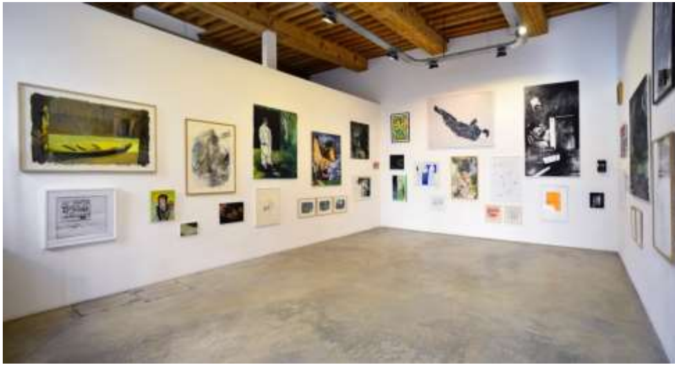
Vue de l'exposition L'œil & le cœur , février 2019, galerie Française Besson.

Active depuis 2004 à Lyon et sur la scène française et internationale, la galerie Française Besson défend et promeut des artistes émergents et confirmés. Particulièrement attachée à défendre la peinture et le dessin sans toutefois s'exclure à d'autres pratiques plastiques contemporaines (sculpture, photographie, vidéo, installations), la galerie organise 6 à 7 expositions personnelles et collectives par an. Chaque année à l'occasion des expositions, la galerie édite un Cahier de Crimée .