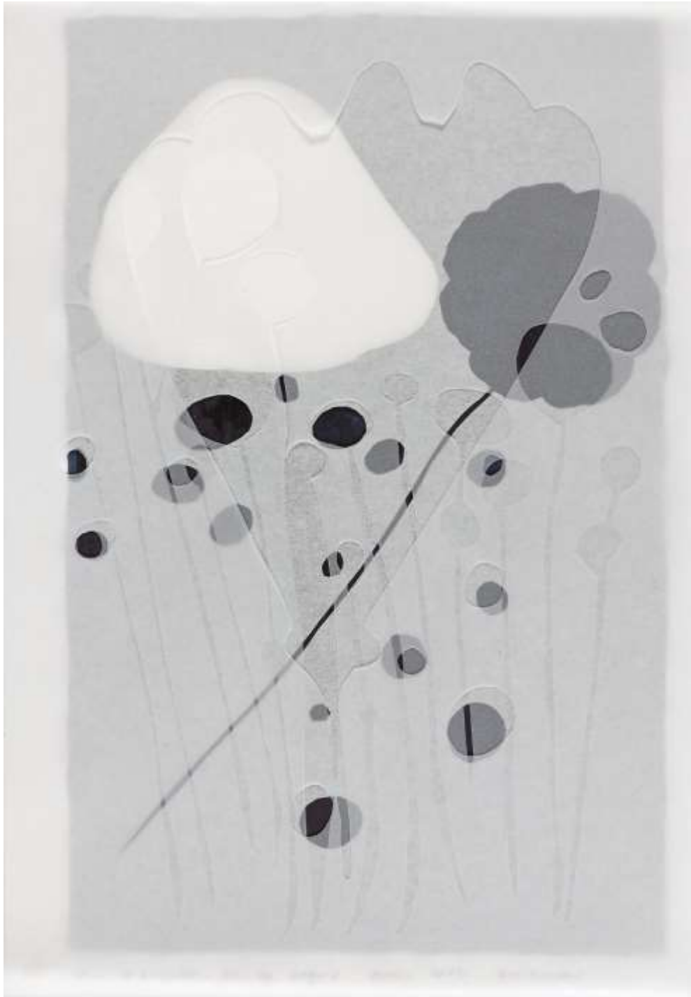
Paysage gris de Payne n°6, 2019 technique mixte sur papiers, 37 x 28 cm, © JL Losi