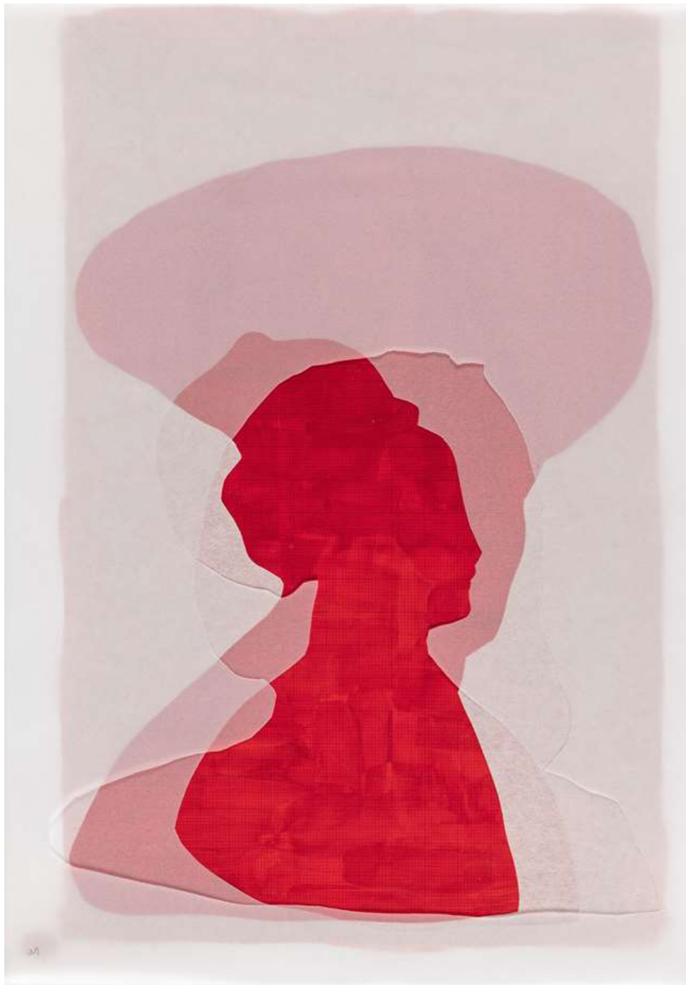
Visage paysage 01, 2019, Piero della Francesca, Filippo Lippi (homme âgé), Pisanello (portrait de femme) technique mixte sur papiers, 37 x 28 cm, © JL Losi