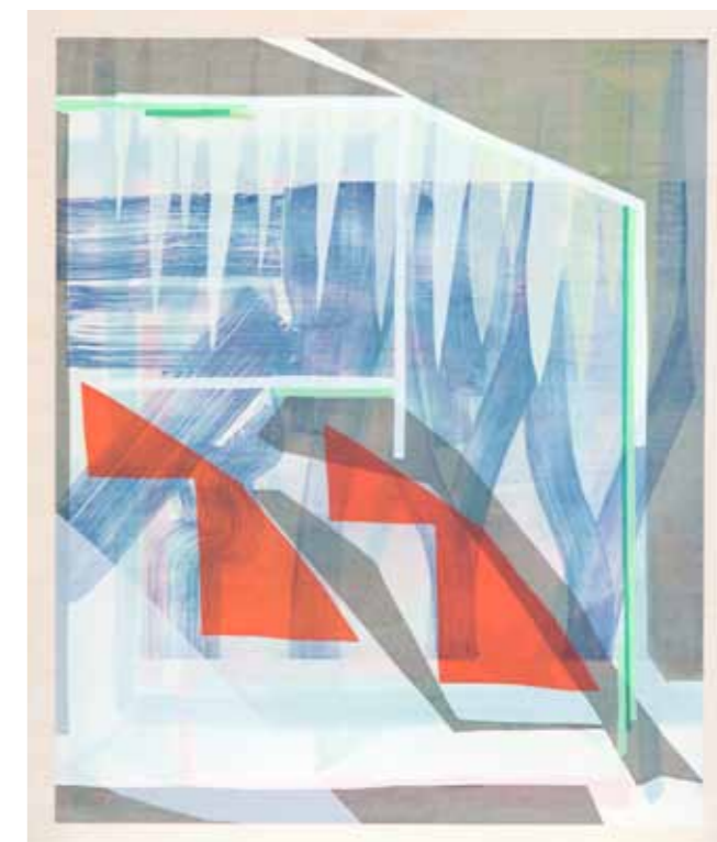
Panorama 2015 18 pièces uniques de 90 x 75 cm (encadrées 92 x 77 cm) sérigraphie sur bois