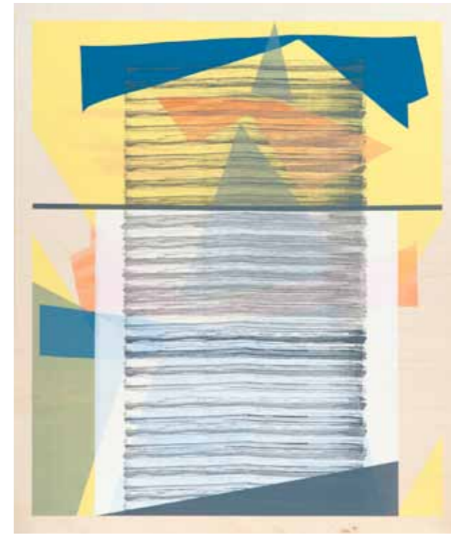
Panorama 2015 18 pièces uniques de 90 x 75 cm (encadrées 92 x 77 cm) sérigraphie sur bois