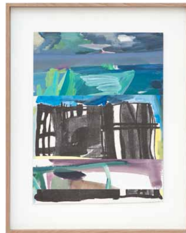
Lithos 2014 48 x 36 cm / 49 x 36,5 / 44 x 34,5 / 44,5 x 33,5 cm encadrées 60 x 48 cm lithographie, technique mixte et collage sur papier