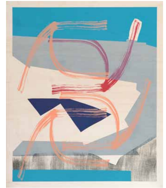
Panorama 2015 18 pièces uniques de 90 x 75 cm (encadrées 92 x 77 cm) sérigraphie sur bois