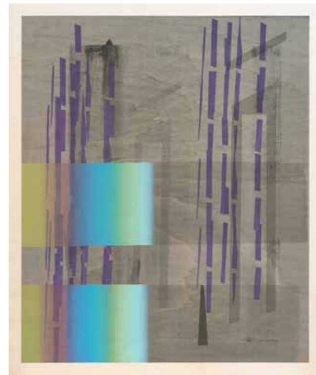
Panorama 2015 18 pièces uniques de 90 x 75 cm (encadrées 92 x 77 cm) sérigraphie sur bois