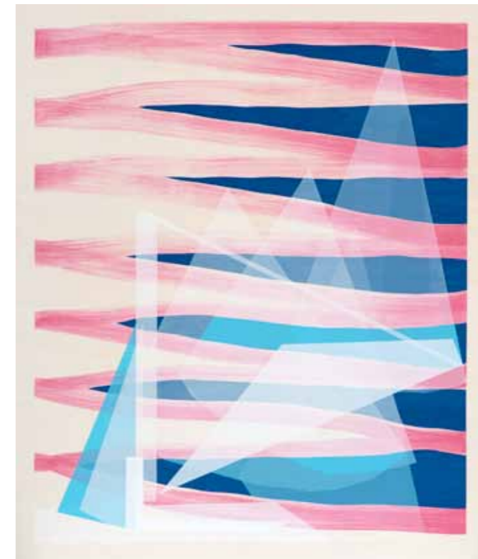
Panorama 2015 18 pièces uniques de 90 x 75 cm (encadrées 92 x 77 cm) sérigraphie sur bois