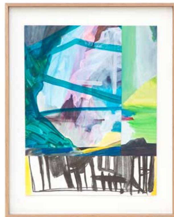
Lithos 2014 47,5 x 34,5 cm / 45,5 x 32 cm / 47 x 36,5 cm encadrées 60 x 48 cm lithographie, technique mixte et collage sur papier