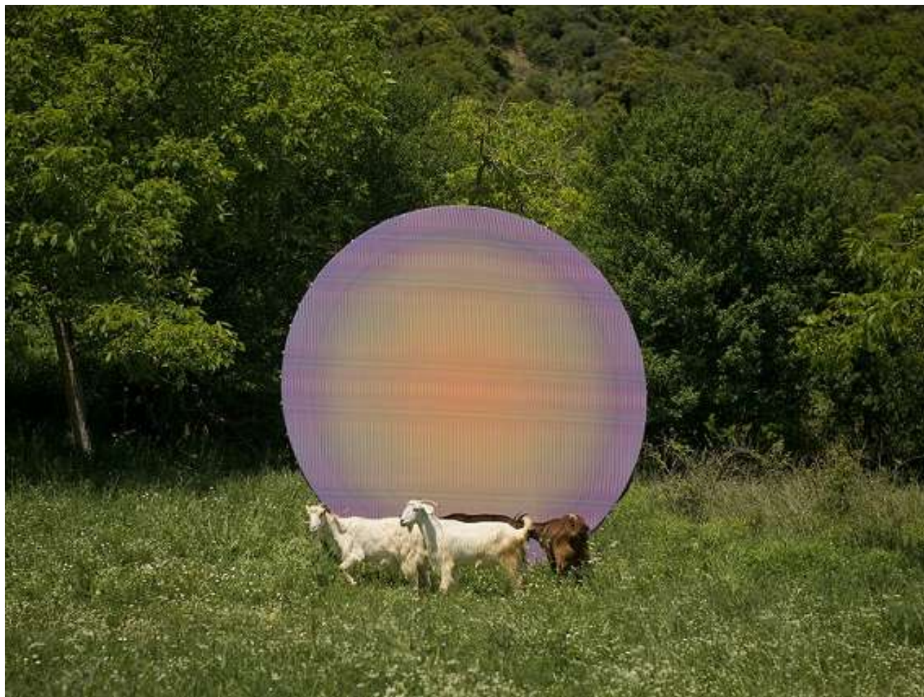
Vérifier l'Arcadie, Loussios 2, 2014, tirage fine Art pigmentaire sur Hannemülhe , 5 ex +1 EA 54 x 74 cm + 3 ex + 1EA 90 x 136 cm + 3 ex 30 x 40 cm