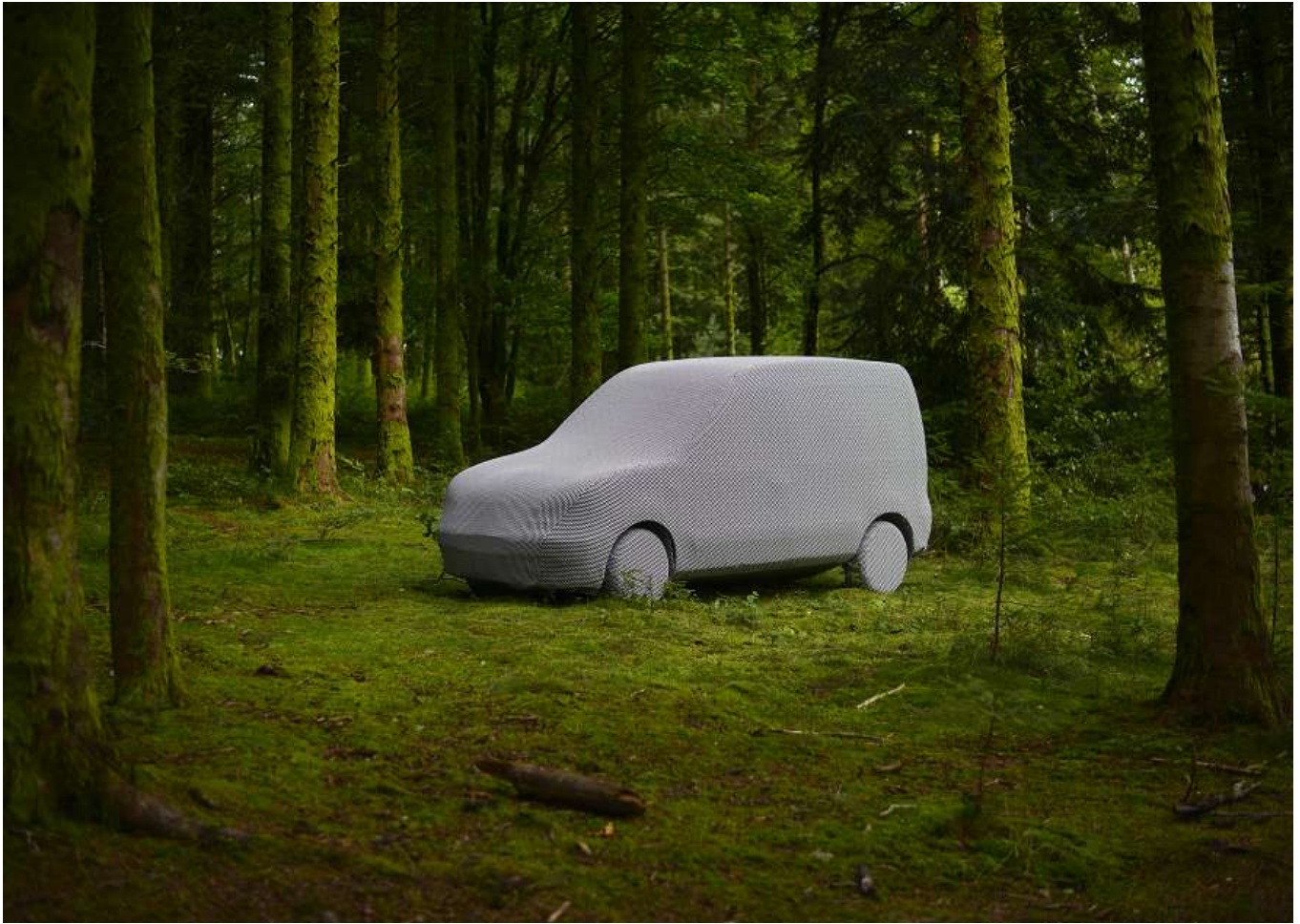
Vérifier l'Arcadie, Vassivière 2, 2014, tirage fine Art pigmentaire sur Hannemülhe , 5 ex +1 EA 54 x 74 cm + 3 ex +1EA 90 x 136 cm