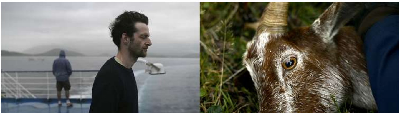
Vérifier l'Arcadie, video stills 4, 2015, tirage fine Art sur Hannemülhe ,5 ex + 1EA, 16 x 58 cm